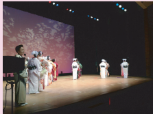
文化ホールステージ発表の様子