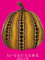
大いなる巨大な南瓜 2011年