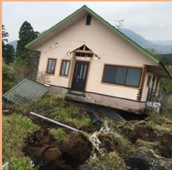
H28熊本地震による被害状況(南阿蘇村)