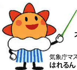
気象庁マスコットキャラクター はれるん