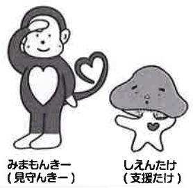
みまもんきー (見守んきー) しえんたけ (支援だけ) 大分市自殺対策推進キャラクター