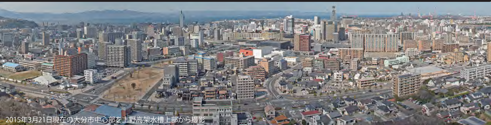
2015年3月21日現在の中心部を上野高架水槽上部から撮影

「まちづくり情報プラザ」では、機会あるごとに市民を対象にしたまちづくりの勉強会を開催することにしています。参加料金は無料です。どなたでも自由に参加できます。お気軽においでください。