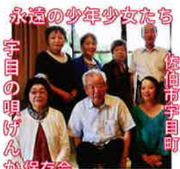
永遠の少年少女たち