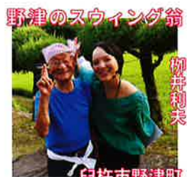
野津のスウィング翁